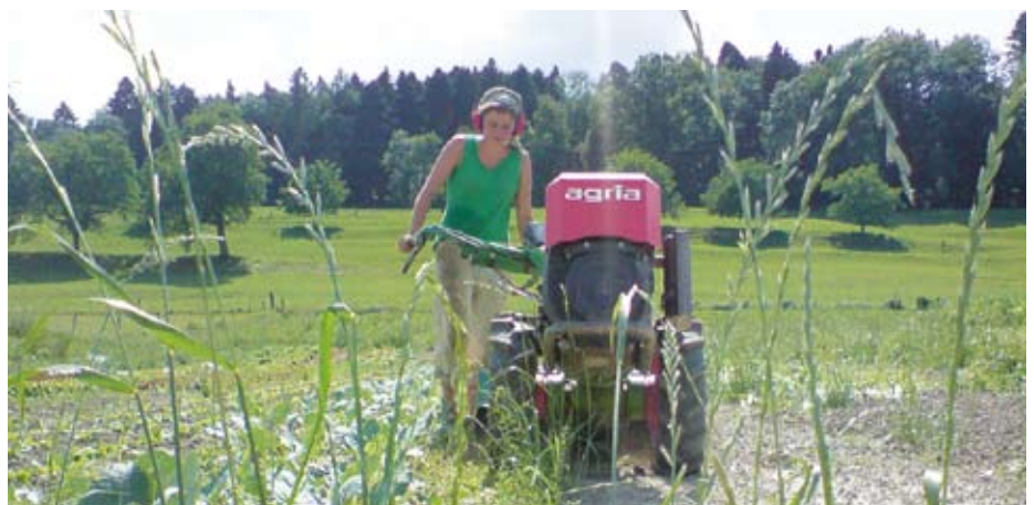
Selbst ist die Frau: Bodenbereitung für die nächste Aussaat

www.ortoloco.ch www.cocagne.ch www.dunkelhoelzli.ch www.xylem.ch www.soliterre.ch www.birsmatthof.ch