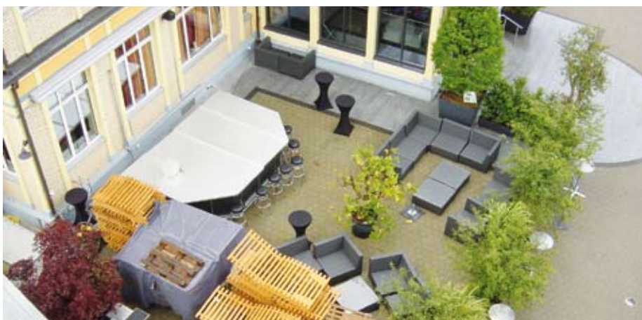
Das «Erholungsgebiet» breitet sich aus – und verdrängt das Landschaftsschutzgebiet.