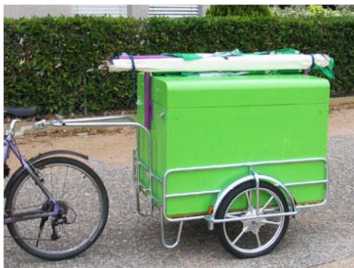
Bald heisst es wieder mit voller Kraft in die Wahlkampf-Pedale treten.

Um dieses Ziel zu erreichen braucht es alle vorhandenen Kräfte: Frauen und Männer, die sich zur Verfügung stellen für die Ämter in den Legislativen und den Exekutiven. Frauen und Männer, die be-