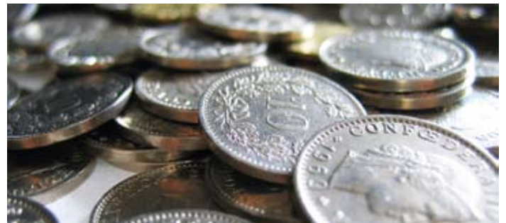
Money, money, money – only funny in a rich man's world?

tionen und hoher Produktivität Sorge tragen, der für die wirtschaftliche Entwicklung zentral ist. Dessen Sorgen liegen aber anderswo: Die Miete steigt, die Krankenkasse wird teurer, der Lohn stagniert.